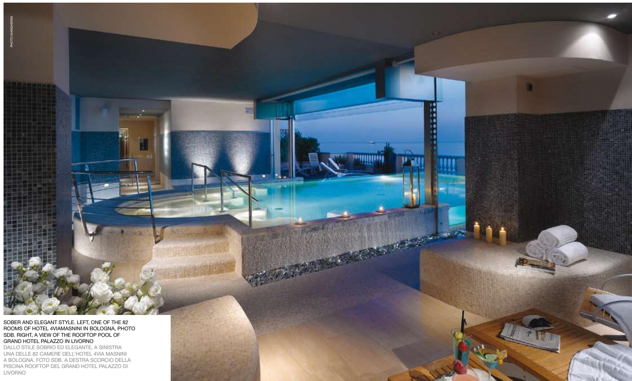
SOBER AND ELEGANT STYLE. LEFT, ONE OF THE 82 ROOMS OF HOTEL 4VIAMASINI IN BOLOGNA, PHOTO SDB. RIGHT, A VIEW OF THE ROOFTOP POOL OF GRAND HOTEL PALAZZO IN LIVORNO DALLO STILE SOBRIO ED ELEGANTE, A SINISTRA UNA DELLE 82 CAMERE DELL'HOTEL 4VIA MASINI A BOLOGNA, FOTO SDB. A DESTRA SCORCIO DELLA PISCINA ROOFTOP DEL GRAND HOTEL PALAZZO DI LIVORNO