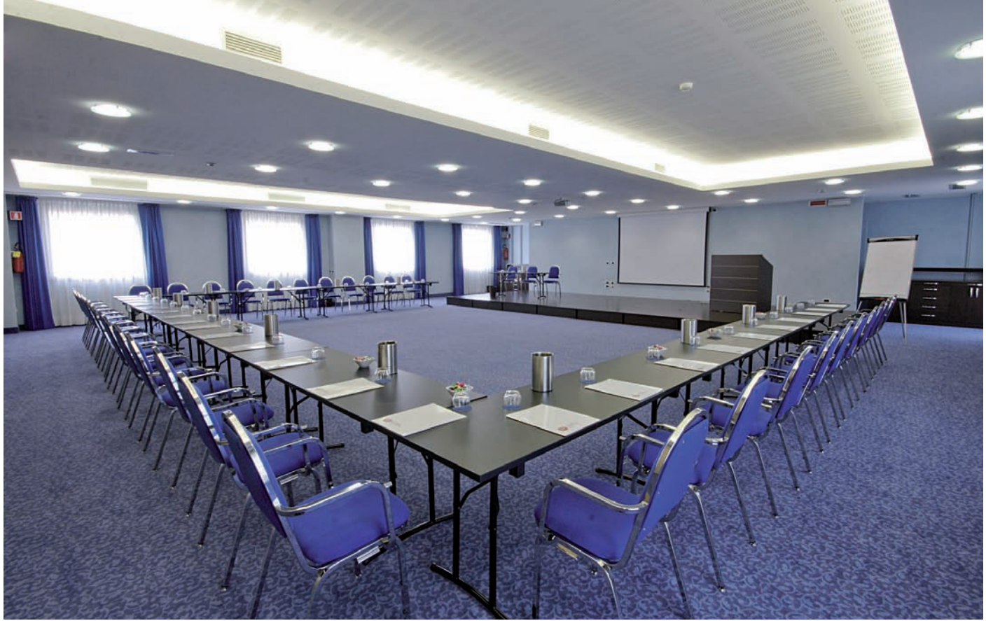
Il centro congressi occupa un'intera ala del piano terreno in un volume libero da pilastri, modulabile con pareti mobili in cinque sale autonome

vari settori hanno consentito una compartimentazione con porte tagliafuoco molto efficace e rendono i percorsi interni immediatamente comprensibili anche all'ospite occasionale: difficile perdersi, semplice trovare una via di uscita in caso d'emergenza.